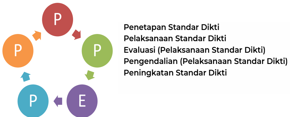
Gambar 01 Implementasi Manual Mutu pada SPMI UIN Syarif Hidayatullah Jakarta

Manual ini berlaku untuk semua standar pada saat standar dirancang, dirumuskan dan ditetapkan. Ruang lingkup implementasi adalah pada aspek Penetapan, Pelaksanaan, Evaluasi (pelaksanaan), Pengendalian (pelaksanaan), dan Peningkatan standar mutu perguruan tinggi. Program Penjaminan Mutu UIN Syarif Hidayatullah Jakarta dilaksanakan secara konsisten dan berkelanjutan untuk menjamin: 1) kepuasan pelanggan dan seluruh pemangku kepentingan ( stakeholders ), 2) transparansi, 3) efisiensi dan efektivitas, dan 4) akuntabilitas pada penyelenggaraan pendidikan tinggi oleh UIN Syarif Hidayatullah Jakarta.