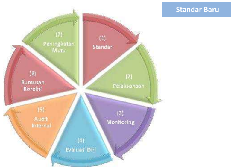
Gambar 03 Penerapan Satu Siklus Sistem Penjaminan Mutu

Untuk secara berkelanjutan meningkatkan mutu setiap standar SPMI yang ada di UIN Syarif Hidayatullah Jakarta setiap berakhirnya siklus masing-masing standar.